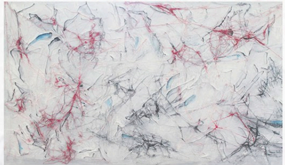
"Groviglio 119", Dimensioni: cm 100x60

"Un'impalpabile ragnatela di suggestive sensazioni che sprigiona dalle sue tele ci avvolge piano piano e imprigiona il nostro animo più tenacemente di quanto potrebbe apparire in un primo momento" (Trenta giorni, periodico d'arte, Torino)